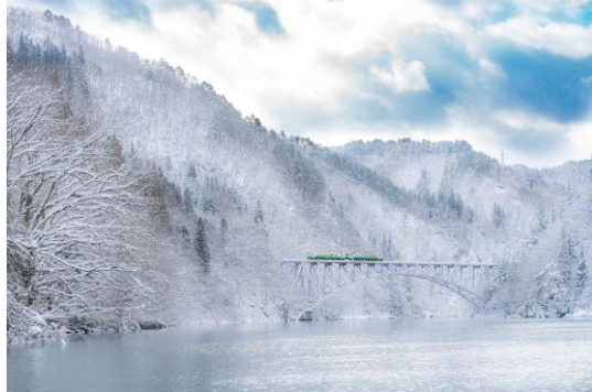
ksk1991fksm さま 福島県 只見線