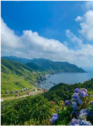
kayo_photograph12 さま 青森県 龍飛岬