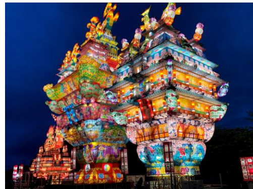
ksty.p.s さま 秋田県 能代七夕 天空の不夜城