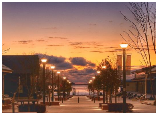
chiemi_019 さま 宮城県 シーパルピア女川