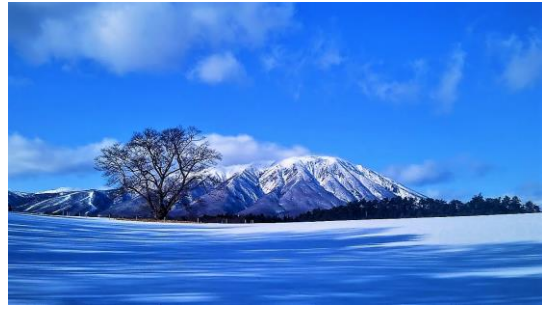
saali_szk さま 岩手県 小岩井農場の一本櫻と岩手山